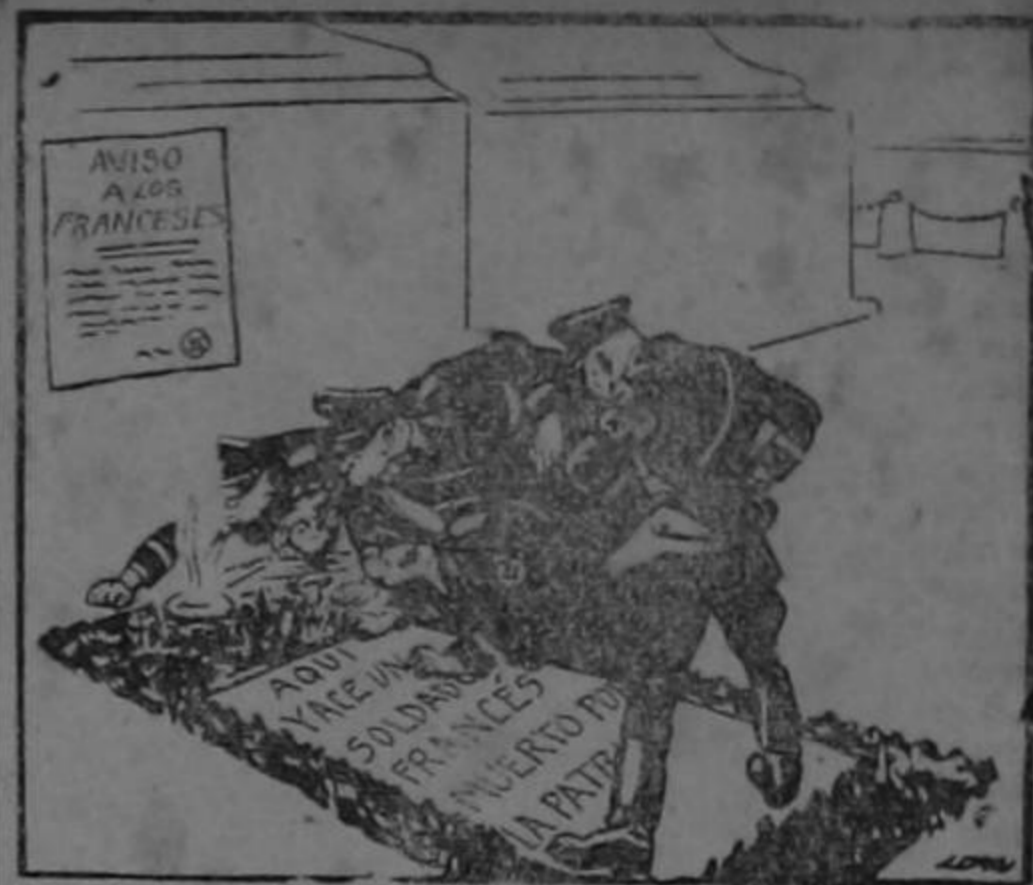
La llama que no se apaga

La publicación y nos reíamos sabrosamente.