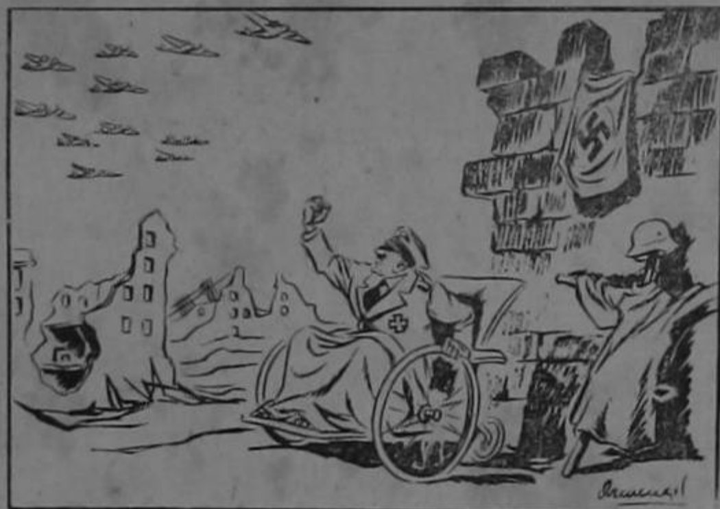
Perro que ladra no muerde...