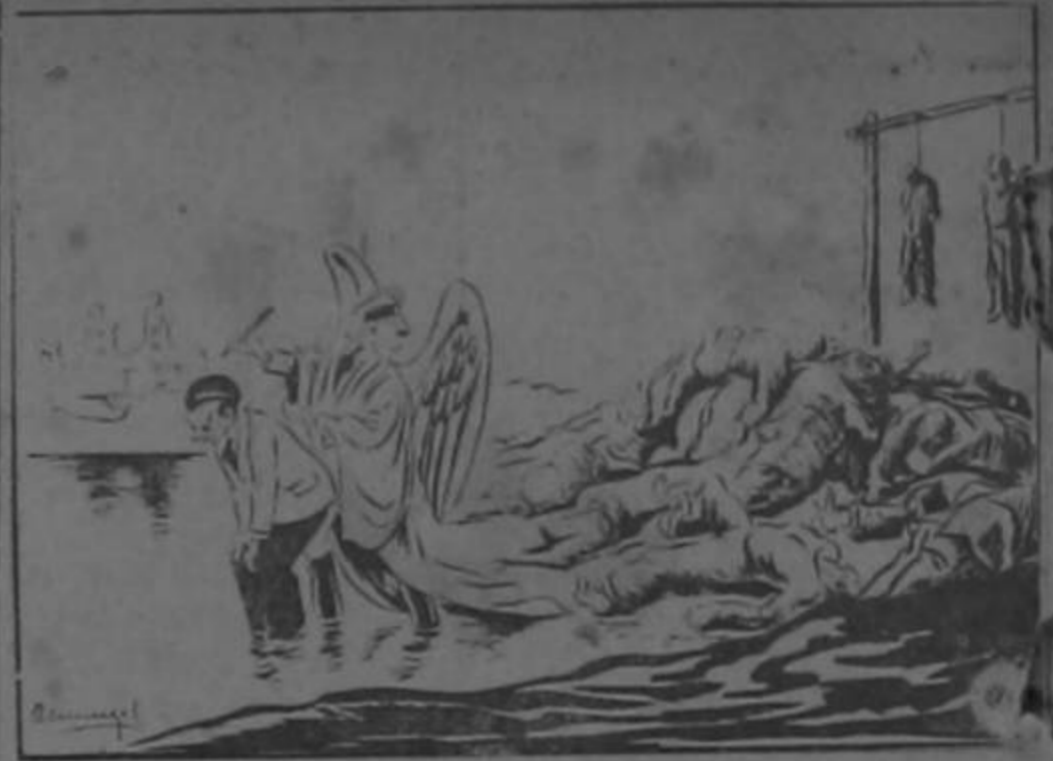
El ángel de la muerte...

A un diputado le oímos en estos días confundir el sentido de ELEVAR. El verbo "elevar" no tiene la acepción de mandar, dirigir, enviar, que algunos le asignan diciendo: "elevaron una nota al Ministerio de Gobernación"; pero puede emplearse en significación de mejorar una persona su condición social o política: "Fue elevado