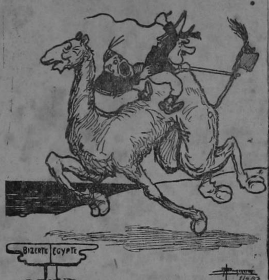
Benito: "No podemos ir más de prisa?"