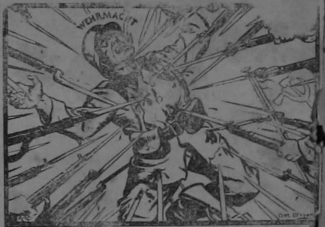
El cerco de acero se va cerrando...

En todo caso, al fin de la jornada, cuando don León haya sido puesto fuera de combate, a sus amigos les quedará el consuelo de los deportistas cuando reciben una espantosa goleada: —Perdimos, pero hay que ver que el triunfo moral fue nuestro!