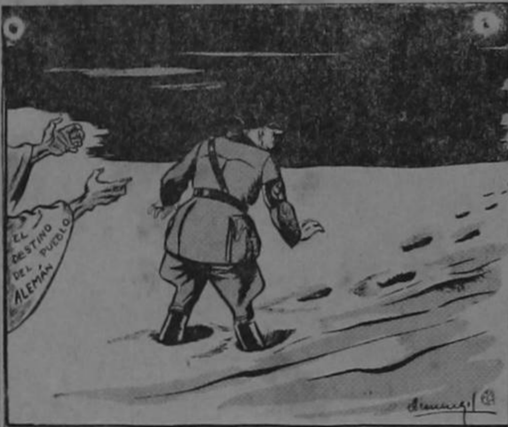
OJOS QUE NO VEN...