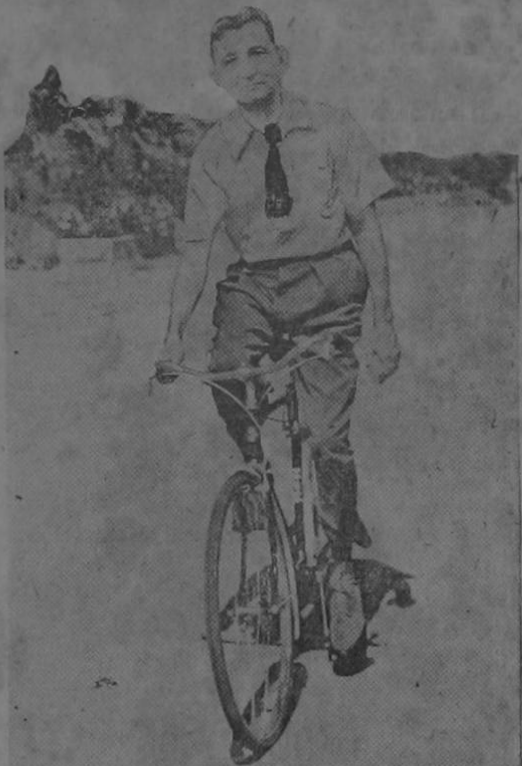
—¡Qué gran cosa es esta carretera interamericana...!